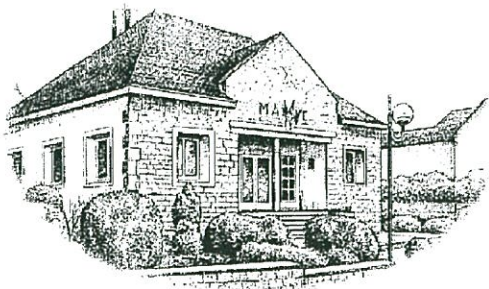
MAIRIE DE ROMAGNY B.P. 24 - 50140

COMMUNE de ROMAGNY 50140 ROMAGNY - MANCHE